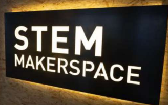
STEM Makerspace 外牆的設計感十足