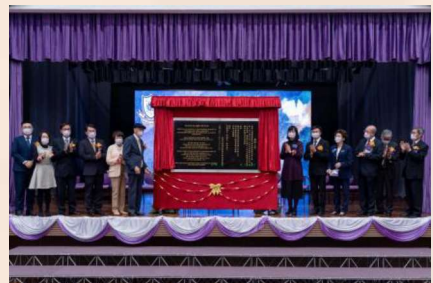
典禮中，眾嘉賓為校碑揭幕。