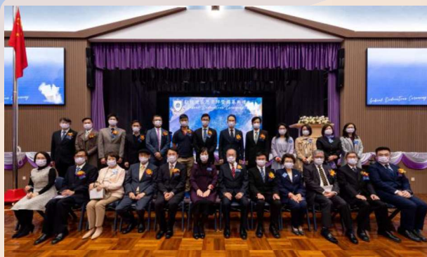
一眾主禮嘉賓拍照留念