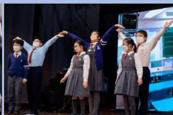
窩心且逗趣的話劇表演