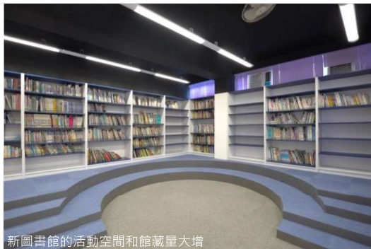
新圖書館的活動空間和館藏量大增

作為喜閱校園，圖書館自不然是最受同學歡迎的場地之一。新圖書館的設計以太空為主題，為同學提供優質的閱讀環境，期望同學透過閱讀，乘夢飛翔。