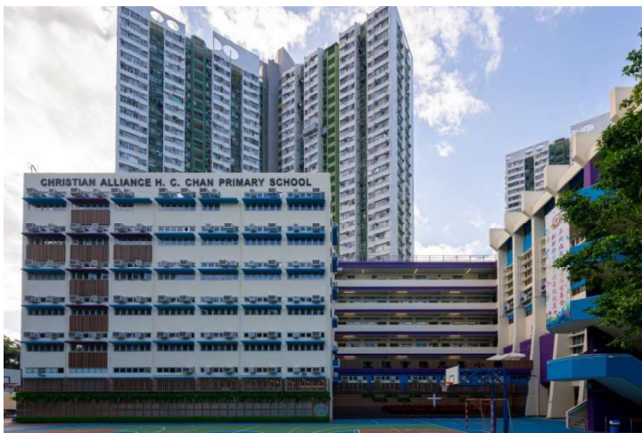
從遠處眺望，學校外牆上的十字架設計清晰可見。

陳元喜是一所基督教學校，新校園希望透過環境教育，讓同學沉浸於濃厚的宗教氣氛之中。