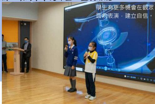
學生有更多機會在觀眾面前表演，建立自信。

為提高學生學習語文的興趣和表達能力，本校決心拓展戲劇教育。新校舍的設計當然也為元喜小孩提供了優良的設備，讓同學享受課堂，盡展潛能。