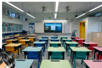
每個教室均設置互動電子觸控白板