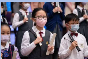
手鐘表演讓人耳目一新