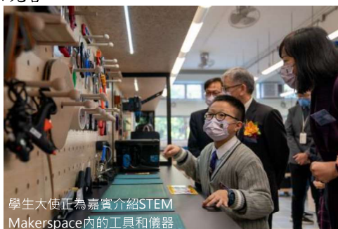
學生大使正為嘉賓介紹STEM Makerspace內的工具和儀器