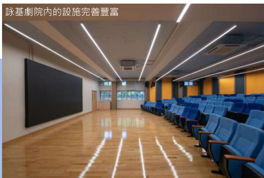
詠基劇院內的設施完善豐富

為提高學生學習語文的興趣和表達能力，本校決心拓展戲劇教育。新校舍的設計當然也為元喜小孩提供了優良的設備，讓同學享受課堂，盡展潛能。