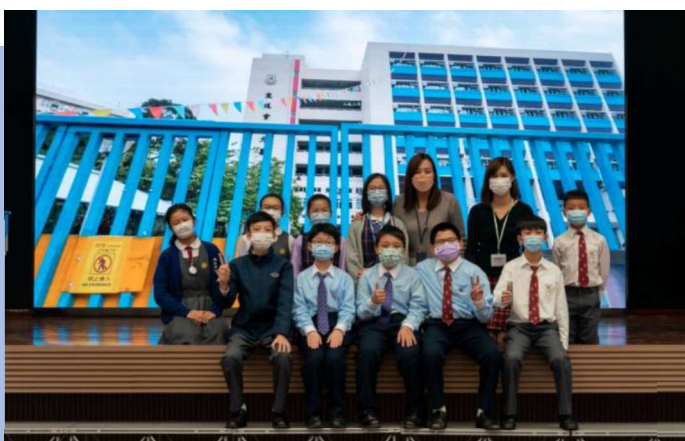
排練話劇的過程，總是笑聲處處。

能在短短兩個多月的籌備時間內完成編、導、演各項工作，全賴同工們的傾力協助；從編舞編曲到拍攝剪接等，皆是同工們的心血之作；一眾演員和合唱組成員，受疫情所限，只能利用清早和小息練習，緊湊的時間下表演或未臻完美，卻是孩子們傾情的演出。盼能觸動人心柔軟那一隅，憶起那敢夢敢想的你。